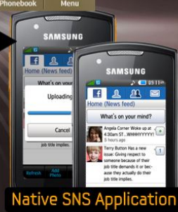
Native SNS Application